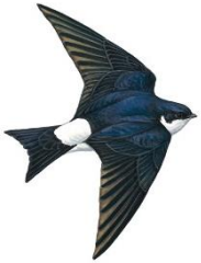
Gwennol y Bondo