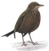
Mwyalchen / Aderyn Du